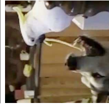
犬に餌を与える インコ！

！！！！キーベツさん、みんなのスケジュール確認からお店の予約まで本当にありがとうございます」と感謝。テレビでの共演は少ないハーフ同士だから、相変わらず新鮮。今回は新メンバーを増やしたい」とつづつた。それぞれの投稿に対し、素敵な会ですね。楽しんで！華やかなハーフ会！！みんな可愛い。豪華！」などとコメントが続々。タオル可愛い！タオルほしい！とベツキー制作のタオルを絶賛する声も上がっている