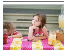
レモネード販売をわずか2週間で10万ドルの企業にした9歳の英国少女

レ）でEXILEの眞木大輔を叱咤激励する看護師も吉田羊だった。その頃、「取り上げるなら今だ」と思い『女性セブン』連載の“山田EYEモード”で対談させてもらった（2013年7月）。ナマの吉田羊は、『純と愛』での役、桐野富士子によく似た、酸いも甘いもかみ分けたアラフォーのキャリアアウーマンそのもので、トークのセンスも抜群にある、魅力的な女性だった。吉田羊のファンは自分たちのことを「ヒツジスト」と呼び、彼女のブログ『放牧日記』に熱心にコメントを寄せている。検事、ホテルウーマン、看護師、女医などなど、キャリアアウーマンを演じさせたら右に出る者はいない吉田羊が『HERO』に出演したことで、私のように（!）「実は前から知っていた」と言い出す人が増えているように思う。ちよつと驚いたのは、『ボクらの時代』（フジ）に合コン仲間である津川雅彦と奥田瑛二が出たときである。女子アナやCA、モデルらがメンバーだった合コンには「後で有名になった子もいる」と津川が言い、そこで名前があがったのがSHIHOと吉田羊だった。ちなみに、女性メンバ