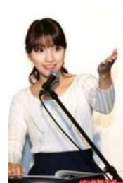
ミタパン女優デビュー?

心部にはアーモンドが鎮座しており、その周りのチョコレートにはマスカルポーをつかっているというこわりよう。単純なアーモンドチョコレートではな、きちんと本物のティラス味がする高貴なおつまに仕上がっています。3位…ツインクルスターベスト3にランキングされたのは、星型のラムネとコンペイ糖が1つの袋に盛り合わされたツインクルスター。こちらは甘いコンペイ糖と少し酸味のあるラムネがセットになっており、同じ星型ではあるけれども、それぞれの味が異なるという、どこか夜のお店のホステスさん達を現したようなおつまみです。いかがでしたか? ベスト3にランキングされたおつまみをみると、単純な甘さだけではなく、本物の素材を忍ばせていたり、隠れたところにキラリと光るワザが効いたおつまみばかり。もし銀座を訪れた際は、おつまみ専門店「岡田かめや」さんを訪れて、銀座のホステスさんが選んだおつまみを味わってみてはいかがでしょう? おつまみの随所に光るそのセンスに、ホステスさん達の「粋（いき）」を感じる事ができるに違いない。