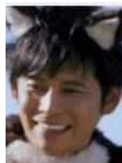
大の着ぐるみ第5弾