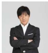
内村光良、NHKドラマ初

1981年11月4日、奈良県出身。2015年1月17日より公開の映画『神様はバリにいる』では、どん底人生を歩む元女社長役でコメディエンヌとしての才能を開花させている。バリを舞台に、謎の日本人大富豪のアニキ(堤真一)から成功哲学を学ぶために弟子入りした祥子(尾野)が、人生観