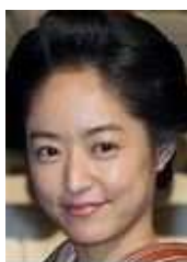
井上真央は創価学会会員

生活情報番組『住人十色 お正月SP 闘う家2014』 で、三船と高橋は新築の自 宅を公開。豪邸には、父・ 三船敏郎の作品を鑑賞する ためのプロジェクトが設 置された多目的ホールや、 高橋の録音スタジオが完備 されていた。「豪邸完成か ら間もなく別居したため、 ここでの夫婦生活はほとん どなかったとか。現在は、 高橋が自宅兼仕事場とし て、1人寂しく暮らしてい るようですね」2人の“ロ ード”は、16年で最終章を 迎えそうだ。