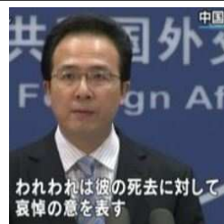
われわれは彼の死去に対して哀悼の意を表す

中国外務省哀悼を表す 中国外務省の洪磊・副報道局長は18日の記者会見で、日本の戦後を代表する名優の高倉健さん死去について「高倉健先生は中国人民がよく知っている日本の芸術家であり、中日両国の文化交流促進のため重要な積極的な貢献を行った」と哀悼の意を表明した。国営中央テレビや新華社通信（電子版）などメディアも死去を一斉に速報。中国で「男らしさの象徴」（中国メディア）となっている高倉さんとの別れを悲しんだ。トウ小平来日で日中平和友好条約が締結された1978年10月、高倉さん主演の「君よ憤怒の河を渉れ（中国語題『追捕』）」などが日本映画として初めて中国で紹介された。同映画は79年に公開されて大ヒットした。文化大革命（66〜76年）が終わり、改革・開放が始まったばかりの中国で、初めての外国映画としてこの映画を見た人は多く「中国大陸で巨大なセンセーショナルを巻き起