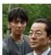
プロデューサー途中隆

だ。最近では悪化しつつあるという情報もあり、「本格復帰は絶望的」という見方が強い。気になる経済面だが、06年にタイアップキヤラクターとして契約したパチンコ台での収入は、うまく稼働すれば億単位になるといわれていたが、それほど売り上げは伸びなかった。固定で支払われたギャラは4,000万円のみで、すでに過去の借金で相殺された。「将来的に中森が生み出す利益を見込んで、スポンサーとして手を挙げた不動産会社社長がいます。今のマネージャーのマンションに移ってくる前は、その会社が所有する東京都内のマンションに部屋をあてがわれ、家賃以外にも生活費などすべてを負担してもらっていました」しかし体調が悪化すると、マネージャーのマンションに身を寄せた。生活はかなり困窮していたというが、今回CDが大ヒットしたことで、経済的には大きく救われたかもしれない。