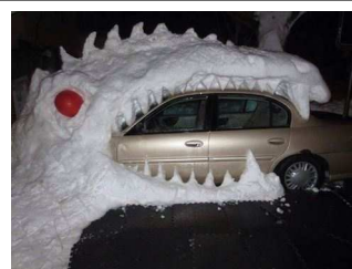
車を飲み込むゴジラ？