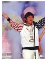
秀樹：脳梗塞から復活

れる黒柳ではあるが、実は誰より真剣にゲストと向き合っているからこそなのだ。黒柳を笑わせること、それは芸人たちの憧れで到底かなわぬ夢として今後もこの番組とともに存在し続けて欲しい。