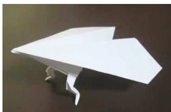
飛行機紙折り 紙の生きた足 夏休み