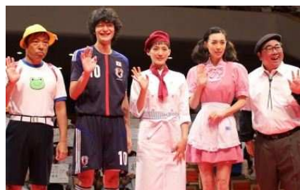
アッコちゃんコスプレ