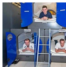
睡眠陣の報道陣、五輪の報道陣がホテルの部屋で寝ている写真。

となっている。ポータルサイト「goo」の「全国花火大会人気アクセスランキン」での1位は第46回葛飾納涼花火大会(東京・7月24日開催)で、2位は第35回隅田川花火(東京・7月28日開催)で、3位は立川まつり国営昭和記念公園花火大会(東京・7月28日開催)と続く。日本一の水上花火が見ものの諏訪湖湖上祭花火大会(長野県・8月15日開催)など、お盆は花火シーズン。また、日本一の大玉花火が打ち上がる片貝まつり(新潟県・9月9日10日)など、秋口にかけて開催される花火大会もある。これから全国で開催される大型花火大会へは、ネットでは花火をより楽しむコツをチェックしてから出かけてみてはいかがだろうか。