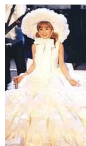
浜崎のステージ地獄絵図

た。歌唱指導の中島早紀先生も「練習してうまくなるタイプですね。1回教えたから次に教えるまでの間に、前回教えたことをほぼ完璧にしてくる。すごい努力家だ」と褒める。将来が楽しみな本格歌手のタマゴだ。