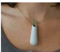
植物をアクセサリに 可愛らしい植物をペンダントに

あつて、人気俳優ジョニー・デップ（49）とフランス人歌手兼女優のヴァネッサ・パラディ（39）の破局が世間に与えたショックは大きい。理由は一体何であろう。最近のデップに世間を敵に回すような発言が増えていること、俳優業よりロックミュージシャンとしての活動に一生懸命で、評判が芳しくないマリリン・マンソンやその仲間たちとの交流に夢中になっていることを挙げるメディアも多いが、アシュレー・オルセンとの噂がそうであったように、単純に「デップが若い女性と遊びたくなっただけ」という向きも多い。そのような中で浮上しているのが、昨年全米で公開された米国人ジャーナリストの伝記映画『ラム・ダイアリー』（原題：The Rum Diary）で共演した、アンバー・ハードとの関係である。彼女は『The O.C.』、『クリミナル・マインド FBI行動分析課』、『カリフォルニケーション』ある小説家のモテすぎる日常』といった人気TVドラマにも出演している26歳の超美人女優で、バイセクシュアルを公言して話題になっていた。ここ5か月間にわたり別居・破局報道を完全否定し、ウソを突き通していたデップだが、『ラム・ダイアリー』の制作に携わった人々の間から、今改めて「撮影中、2人は間違いなく肉体関係を持っていた」という声が漏れ始めている。確かにデップは、その作品のプレミア上映会にヴァネッサを伴うことをしなかった。いや、ヴァネッサが拒んだ可能性もある。バイセクシュアルを公言しているアンバーとの情事を否定するのは簡単であるが、火のない所に煙は立たないのだ。撮影セットでは無数の人々が役者をじつくりと観察しているものである。