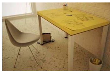
付箋紙で作った机

妻夫木聡（31）、女優の武井咲（18）、歌手の青筋（35）が13日夜、都内で行われた映画「愛と誠」のジャパンプレミアに参加した。三池監督の母校、大阪・常翔学園高校で行われた先行上映会にも出席。生徒から武井との密着シーンの感想を聞かれたと明かし「役としては感じてるけど、僕としては感じてない」