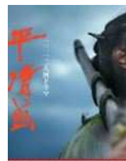
作: 高橋 聖子 監修: 高橋 聖子 演出: 高橋 聖子

5月27日の第21回で視聴率10・2%(ビデオリサーチ調べ、関東地区)を記録するなど、墜落寸前の超低空