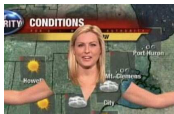
緑の服を着ちゃった！ 透明人間になって解説？

英国で始まったロンドン五輪の聖火リレーで、既に走り終えた走者が聖火のトーチをインターネットオークションに出品、15万ポンド（約1900万円）を超える高値で落札されるケースも出ており、物議を醸している。英メディアが21日、報じた。トーチは金色のアルミ合金製で、製造費用は1本495ポンド。走者は200ポンド前後で記念に買い取ることができ