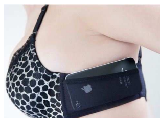
腹巻ならぬ・小物入れ 隠せる? 携帯ホルダー だっただけ トルビス 現代版