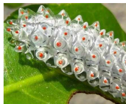
宝石のような芋虫 成長すると蛾に！！