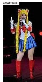
しよこたん中国初ライブ!

が、方便として許されるのは、本当に相手のことを思いやったケースのみ。単に自分を守るための嘘がバレて、「この女、嘘つきだな」と思われた瞬間、その男性との仲はそれ以上進展する見込みはないでしょう。以上、2回にわたり男性にとつて我慢できない嫌な女トップ10をお届けしましたがいかがでしたか?ひとつでも当てはまる項目があれば、この機会にぜひ克服しましょう!