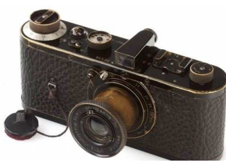
90年まえのライカ社製カメラ 値段は、230万ドル!